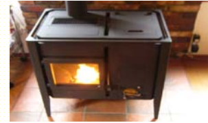
ペレットストーブには、信州型ペレットストーブ等の様々なタイプがあります。

下記の市町村に居住されている個人又は事業者の皆様で、平成22年度中(市町村が定める日)にストーブ等を設置できる方が対象となります。