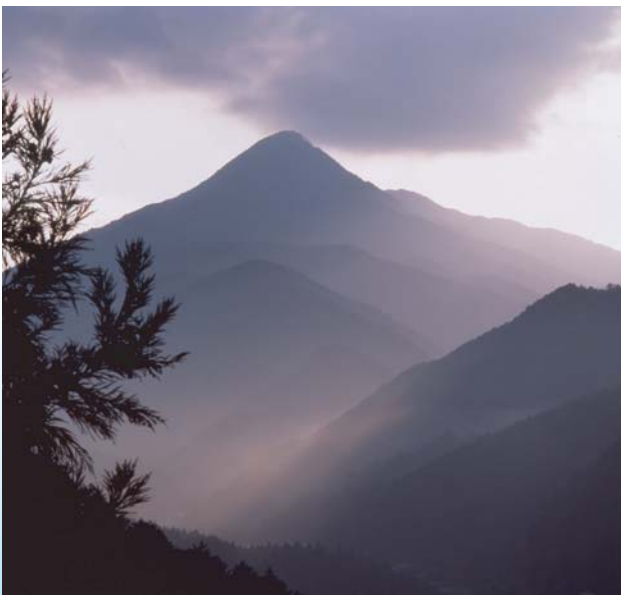
吉野杉に代表する豊かな森を育む東吉野村